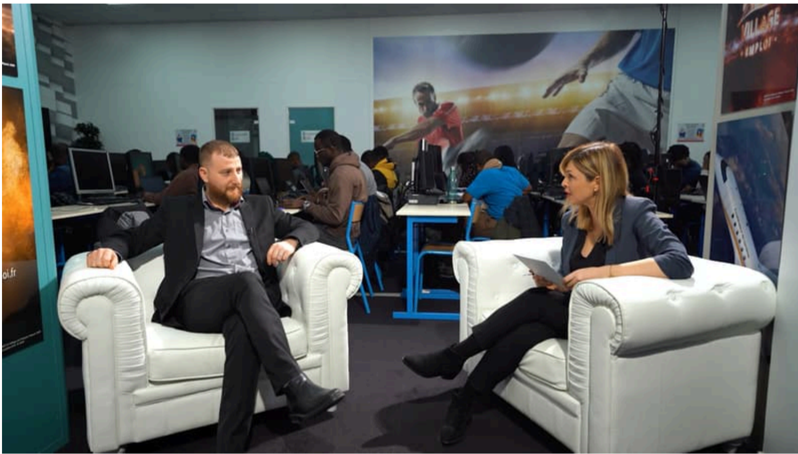
Depuis près de 25 ans, le Village de l'Emploi applique une méthodologie afin de faciliter l'entrée des jeunes diplômés sur le marché de l'emploi. - Village de l'Emploi

Pour faciliter l'entrée des jeunes diplômés sur le marché de l'emploi, le Village de l'Emploi a développé une méthodologie appliquée depuis près de 25 ans au sein de son établissement. Depuis 1998, les jeunes lauréats y sont formés aux métiers de l'informatique et accompagnés de manière efficace et personnalisée par une équipe d'experts et d'employeurs partenaires.