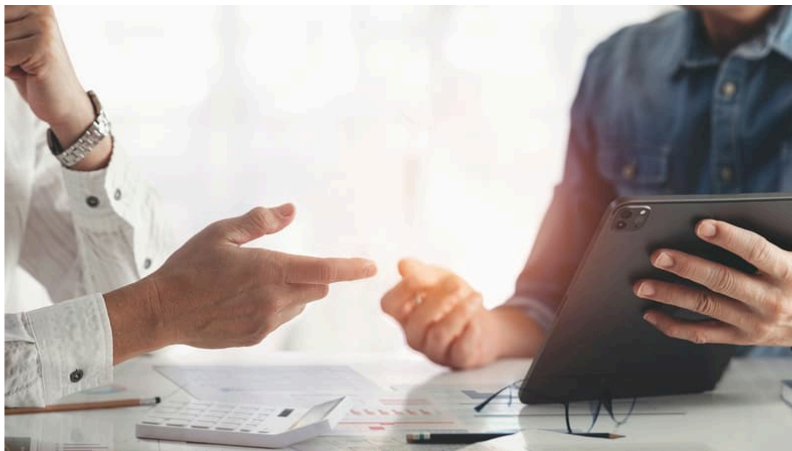
Village de l'Emploi : accélérer sa carrière dans l'IT, c'est possible - Village de l'Emploi